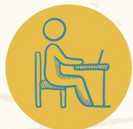
Leren en studeren

Ik kan me moeilijk concentreren in de klas.